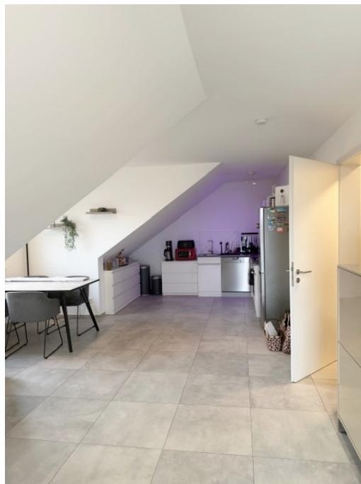
Küche - Essbereich